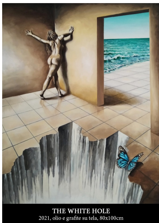
THE WHITE HOLE 2021, olio e grafite su tela, 80x100cm